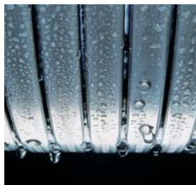
Inox-Radial-Wärmetauscher – langlebig und effizient